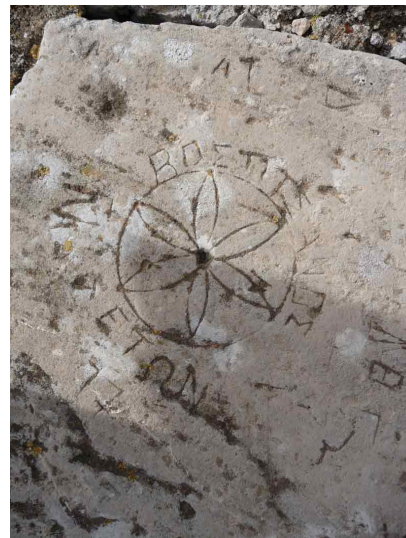
Die Blume des Lebens im Ephaia-Tempel auf Ägina

Die Ägäis ist die Heimat der Undinen, den Wasserwesen des antiken Griechenlands. Ich sehnte mich daher nach dem idealen Ort in der Ägäis, wo wir in tiefen Kontakt mit unserer Seele treten können. Meine innere Führung schickte mich nach Ägina und von dort nach Agistri.