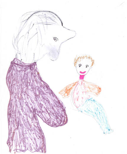
Der Troll und die Nymphe begegneten mir in einer tiefen Trancemeditation und leiteten mich nach Griechenland.

Wir nutzen Rituale, Meditationen, Übungen in der Stille am Wasser und im Wald, um in Kontakt mit den Naturwesen und unserer Intuition zu kommen.