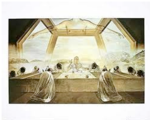
Salvador Dali: Das letzte Abendmahl

Als Hilfe dient die Aethos Sound Meditation, kann man kostenlos herunterladen von tomkenyon.com